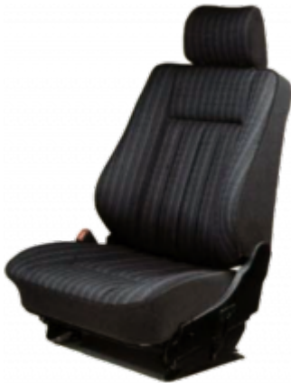
Die serienmäßige Stoff-Ausstattung (Abb. zeigt Mopf1)

Insgesamt gibt es acht Farben und sieben verschiedene Polsterungen. Zusätzlich gibt es spezielle Polsterungen für den 500E / E500. Zwischen 1985 und 1997 gab es daher über 70 Variationen der Sitze. Die Stoffpolster wurden zum Beispiel mit jeder Modellpflege (Mopf) mit einem neuen Muster versehen, während Lederpolsterungen von Mopf 0 auf Mopf 1 geändert wurden. Die genauen Unterschiede und Veränderungen während der Bauzeit findet ihr auf den folgenden Seiten.