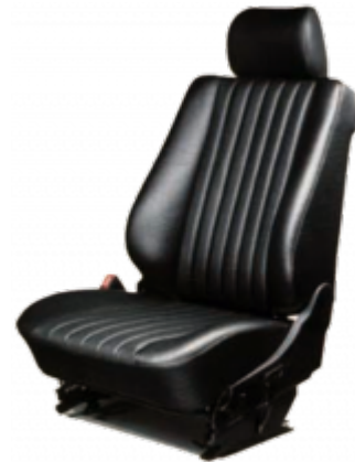
Außerst strapazierfähig, in Optik und Eigenschaften lederähnlich: MB-TEX als Sonderausstattung