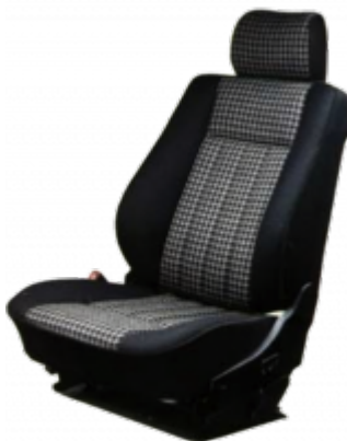
Die serienmäßigen Sitze sind auf Wunsch auch in sportlich betontem Karo-Design erhältlich