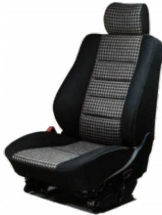
Der Sportline-Sitz: ausgeprägte Schalenform