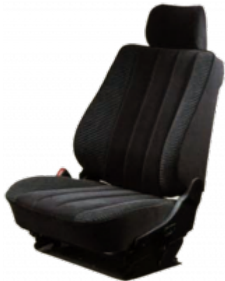
Eleganter, atmungsaktiver Velours-Bezug für die Sitze ist als Sonderausstattung erhältlich