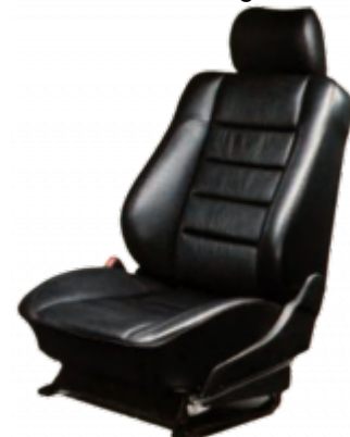
Der Sportline-Sitz ist auf Wunsch auch in exklusivem Weichleder erhältlich